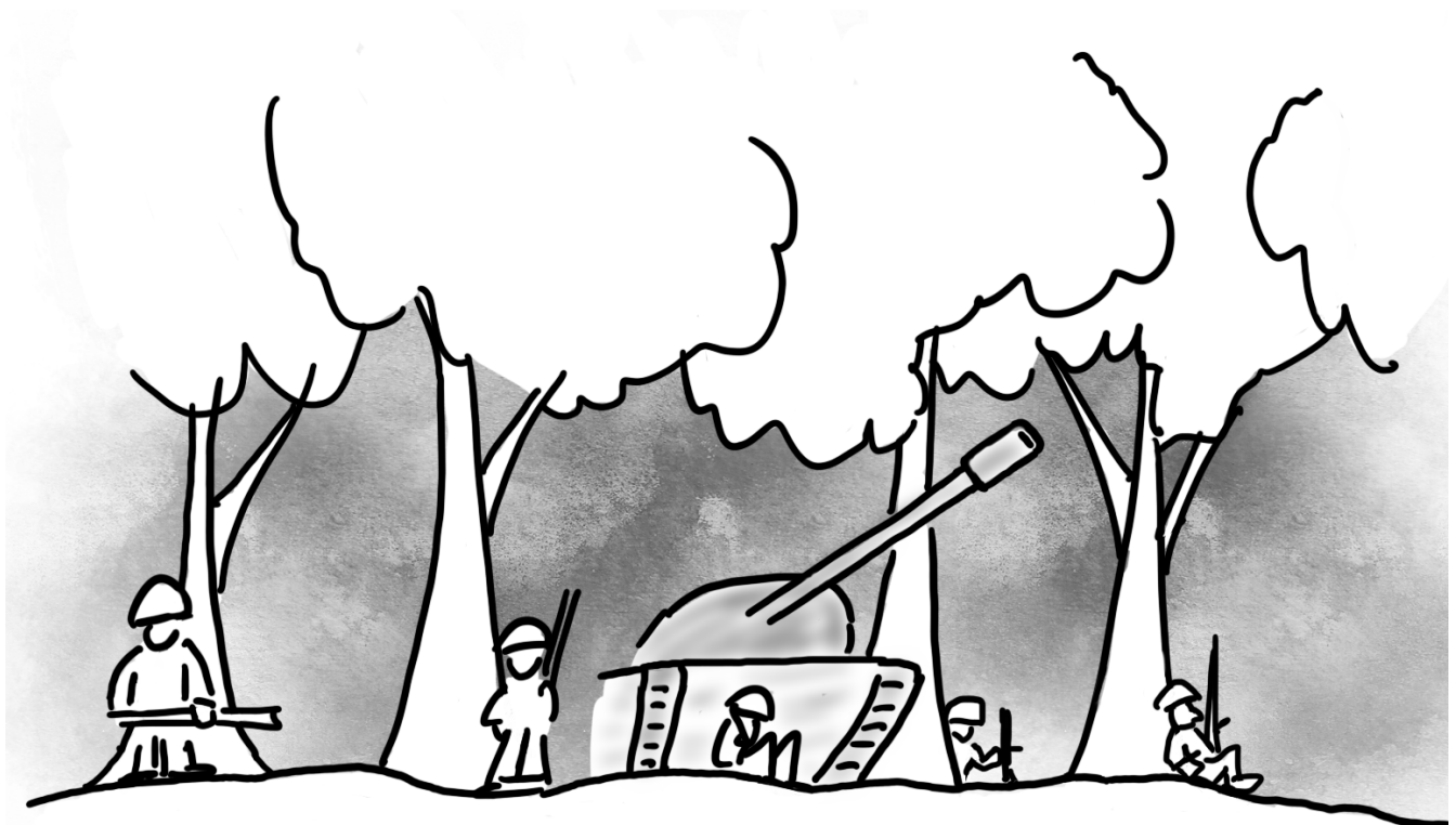
Figure 2. Los soldados aguardan la llegada de los aliens.

Los países que aún eran libres crearon una formidable fuerza de ataque y montaron su base en las Islas Marshal. Los aliens debieron de olvidarse de la isla y se cree que los soldados siguen por ahí.